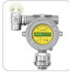
Alarm Beacon Type (알람 경광등 부착형)