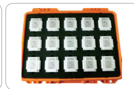
Cartridge Carrying Case